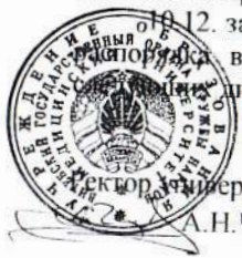
Ректор университета А.Н.Чуканов

10.18. освобождать обучающихся от занятий на основании личного письменного заявления, поданного накануне, без отработки пропущенных занятий, (или – с отработкой пропущенных занятий) (по договоренности сторон) в связи с нижеперечисленными личными обстоятельствами: